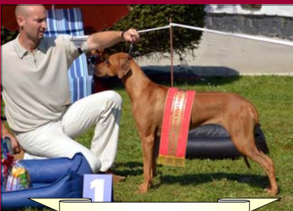
Tusani Lady Melody

pár - Dius Cassius + Dreamed Yman by Luanda Naj Chov. skupina - LOWENSWWANZ Naj ridge - ANAEL LENNOX KE-FA-RI'S ml.hlava ♀ - Keyah Perla Afriky Lowenschwanz Naj hlava ♀ - ALEXIS FEMME FATALE LUANDA Naj ml. hlava ♂ - TUSANI LORD COPYRIGHT