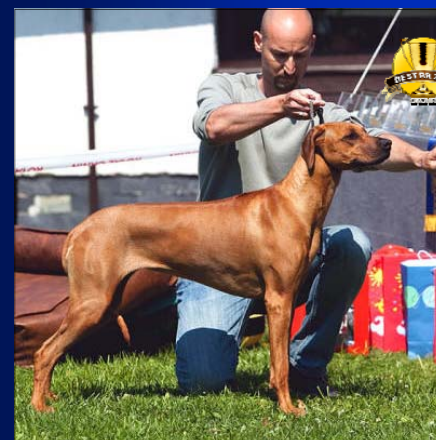
~ Mladá vice-suka roka ~ Tusani Lady Melody