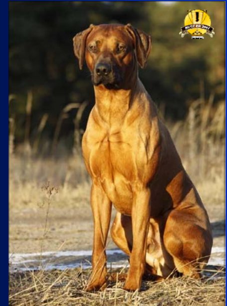
Mladý pes roka ~ Glenholm Taariq