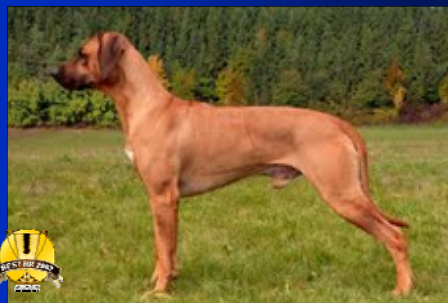
Pracovný pes roka ~ Chayton Perla Afriky