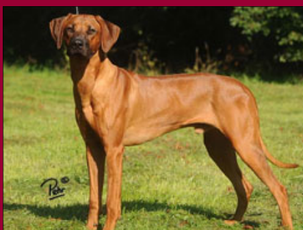
Glenaholm Taariq - Junioršampión SK

slabá; zalomené chvostíky: 0; DS: 0; pruh: 2x; skusy: 10x nožnicový; semenníky u samcov: všetky hmatné a zostúpené; kondícia vrhu: šteniatka vyrovnané, socializované, veľmi pekné. kontrolu vrhu vykonala: Lívia Lakotová 01.11.2011