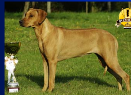
~ Vice-šampiónka roka ~ Tusani Extra Spice