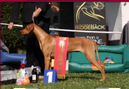
Dreamed Yman by Luanda