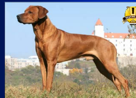
Vice-šampión roka ~ Alpha of Shingamonga