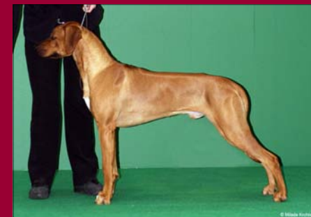
Dius Cassius by Luanda - JuniorCh HU