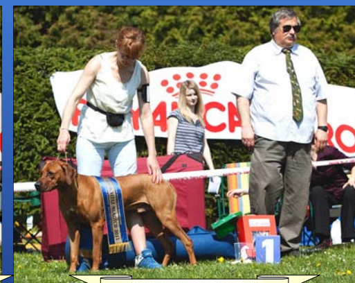
Tusani Lord Copyright