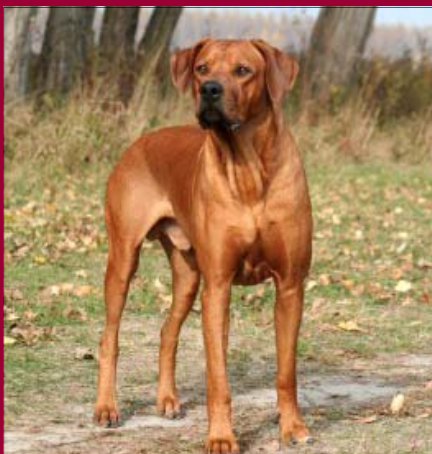
Alpha of Shingamonga Šampión HU, Interšampión

farba stredná sýta pšenica; biele znaky: 2x bez, ost. v rámci štandardu; maska: 2x; zalomené chvostíky: 3x (tet.č.: 1571, 1573, 1578); DS: 0; pruh: 0, skusy: 3x podkus (tet.č.: 1572, 1574, 1578), 6x nožnice; semenníky u samcov: v čase kontroly nezostúpené; kondícia vrhu: výborná, šteniatka socializované, matka vo výbornej kondícii.