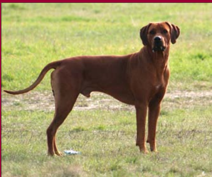
Habi Alex Asilia Lowenschwanz Šampión HU, HR, Interšampión