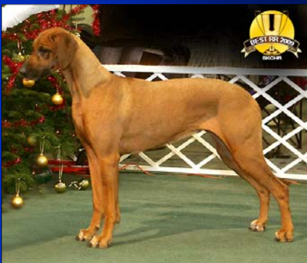
~ Vice-veteránka roka ~ Macumazahn Malawi Magic

laik), súčasťou zmluvy je očkovací preukaz s aktuálnym zdravotným záznamom veterinára. Chovateľ by nemal umiestniť psika, pokiaľ nie je zdravý alebo má pruh či nezostúpené oba semenníky. Ak tak urobí, musí na to nadobúdateľa upozorniť v zmluve. Chovateľ by mal byť v kontakte s majiteľmi šteniat, zaujímať sa o ich zdravotný stav, sledovať ich vývoj a pokiaľ môže, niekoľkokrát osobne prehladnúť psa v období jeho vývinu.