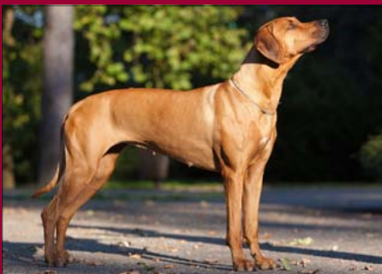
Tusani Famous Sheena - Šampión SK