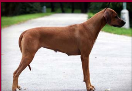
Audacity Ajani Ukerewe - Šampión HU