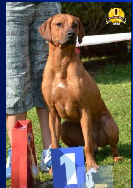
Mladý vice-pes roka ~ Tusani Lord Copyright ~