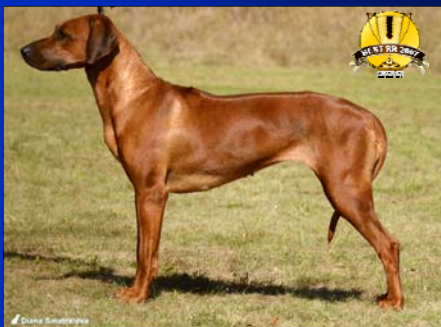
~ Vice-suka roka ~ Ridgeback Hiari Chanya