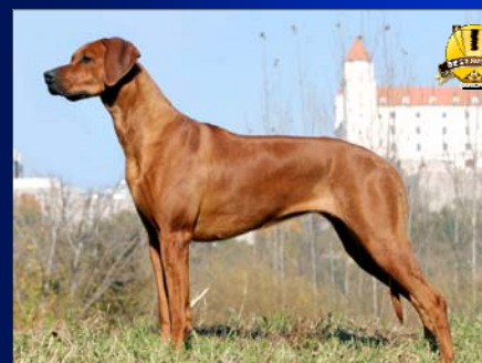
Suka roka ~ Habebah Asilia Lowenschwanz