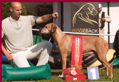
Macumazhn Tusani Pearl

k ich práci, ba dokonca odsudzovať. Odchovať vrh je u mnohých citová záležitosť a je to fakt náročná práca a navyše je to práca so živým materiálom, kde aj tak posledné slovo povie príroda a to my nedokážeme nijako ovplyvniť.