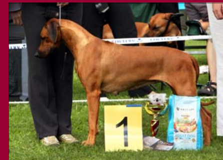
Alexis Femme Fatale Luanda - ICH Šampión CZ, HR, KCHRR, GrandCh HU

nar. spolu 9 (6/3), zapísané 9 (6/3) kontrola vrhu 10.06.2011: ridge: 9x štandard;