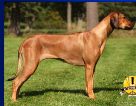
~ Mladá suka roka ~ Tusani Jolly Joelin