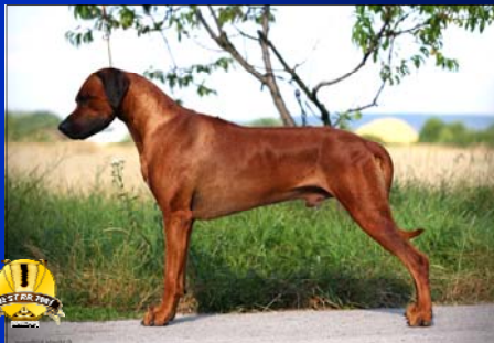
Šampión roka ~ Awesome Enzo by Luanda