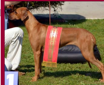
Tusani Lady Melody - Junioršampion SK