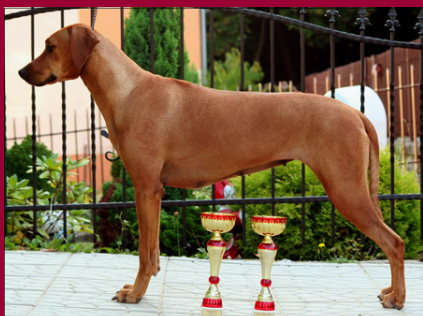
Tusani Happy Zaira ~ Interchampion splnené podmienky