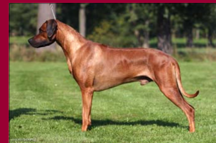
Awesome Enzo by Luanda Šampón PL, HU, SK, CY, BG, MKD, MNE