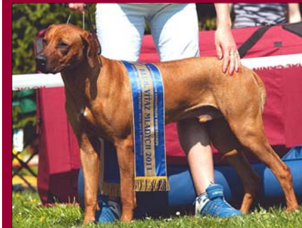
Tusani Lord Copyright - Junioršampion SK