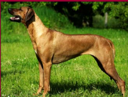
Tusani Happy Zippy - Šampión PL