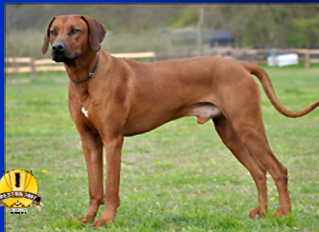
Pes roka ~ Ya-Ba-Ra Boss