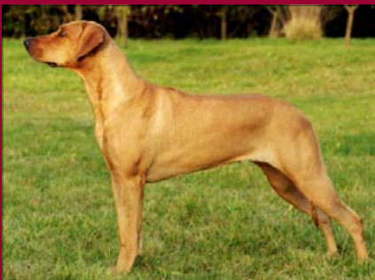
Tusani Extra Spice - Šampión SK, SKCHR