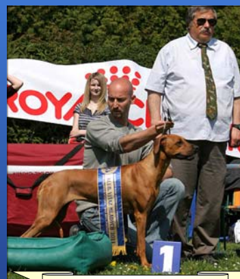
Tusani Lady Melody