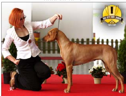
Ch. Tusani Extra Chilli ~ Mladá vice-suka roka ~