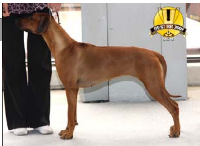
Jch. Alexis Femme Fatale Luanda ~ Mladá suka roka ~