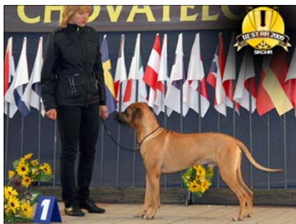
Jch. Tusani Cool Cooper ~ Pracovný pes roka ~