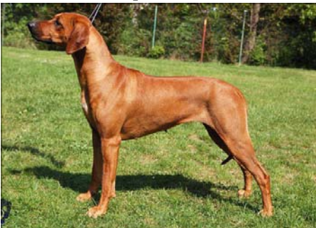
Art Monroe HelyaRidge ~ Šampión Česka ~