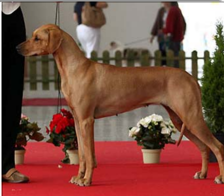
Ch. TUSANI EXTRA CHILLI 15.11.2009 MVP Kielce, CAC, CACIB, BOB ~ splnené podmienky Interchampion ~