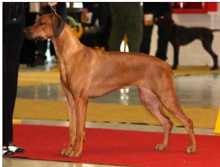
Alexis Femme Fatale Luanda ~ Junioršampión Česka ~