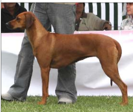
Bria Krasny ridge ~ Šampión Maďarska ~