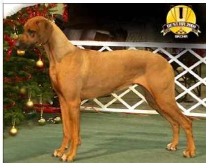
ICH. Macumazahn Malawi Magic ~ Veteránka roka ~