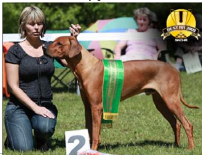
Alpha of Shingamonga ~ Mladý vice-pes roka ~