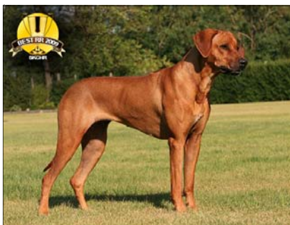
Ch. Aba Witty Ajani Ukerewe ~ Vice-suka roka ~