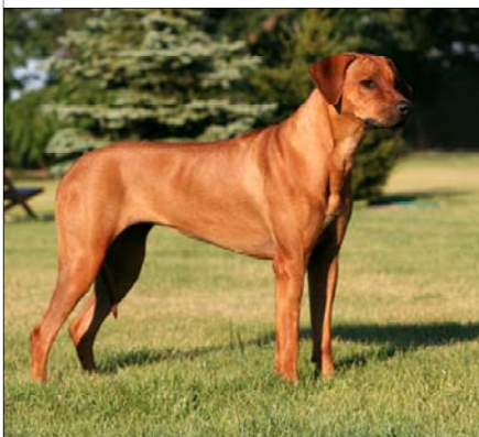
Aba Witty Ajani Ukerewe ~ Šampión SK a CZ ~