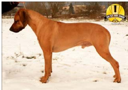
Ch. Chayton Perla Afriky ~ Vice-pes roka ~