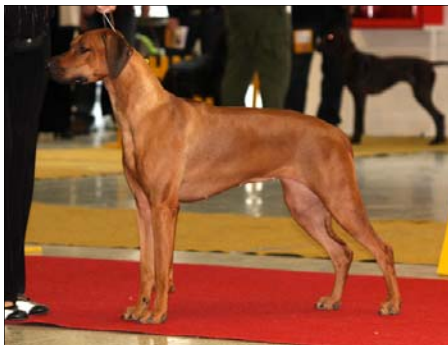
Jch. Alexis Femme Fatale Luanda 05.12.2009 MVP Nitra, CAC, CACIB