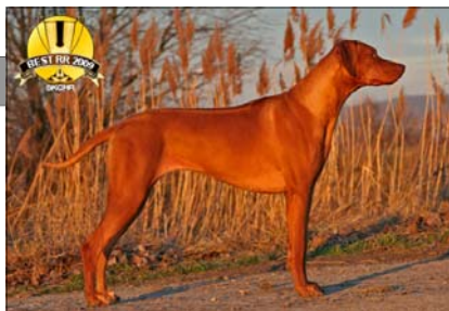
ICH. Hillyvalley's Angel for Luanda ~ Šampiónka roka ~