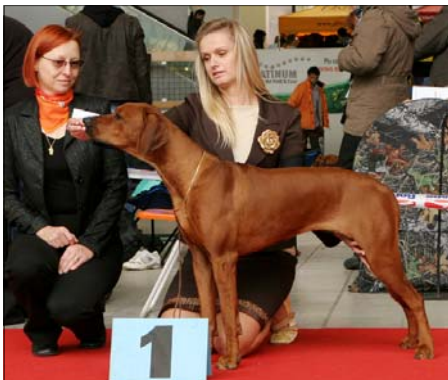
Habebah Asilia Lowenschwanz 17.10.2009 NVP Brno, CAJC, BOB, BIG3