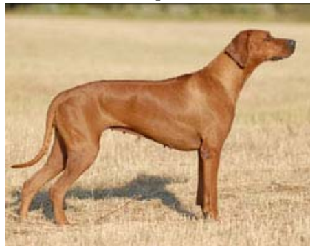
Ch. Fidorka Aquila Bojnice ~ Šampión SKCHR ~