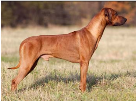
African Panthera Leo Coffie Šampión Maďarska

Blahoželáme k novým titulom a držíme palce, aby sa im aj naďalej darilo tak krásne a úspešne prezentovať naše plemeno vo výstavných kruhoch doma i v zahraničí.