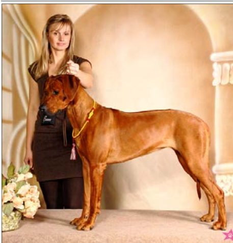
Habebah Asilia Lowenschwanz 28.11.2009 MVP BUDAPEST V1, HPJ, Naj.mladý pes, BOB