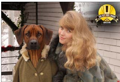
Ch. Nalongo Gamba ~ Pes roka ~