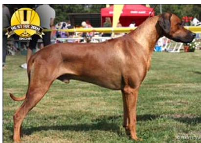
Awesome Enzo by Luanda ~ Mladý pes roka ~