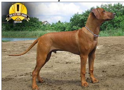
Ch. Ridgeback Hiari Abayomi ~ Šampión roka ~