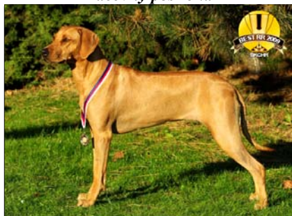
Ch. Tusani Extra Spice ~ Pracovná suka roka ~