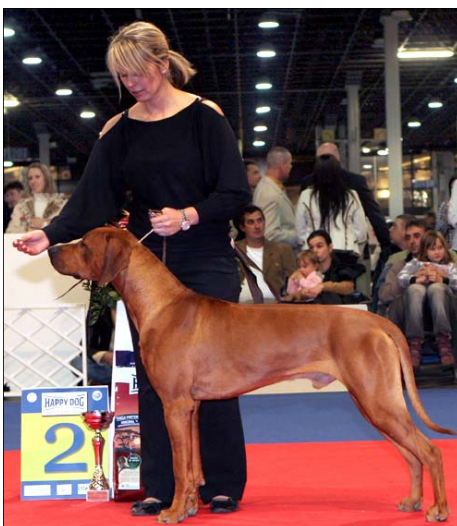
Habi Alex Asilia Loewenschwanz 29.11.2009 Derby Budapešť CAJC, BOB, BIG2