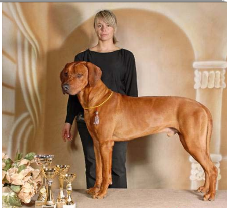
Habi Alex Asilia Loewenschwanz ~ Jujioršampión H a CRO ~