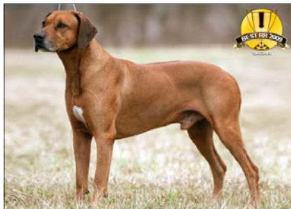
Ch. David Aquila Bojnice ~ Veterán roka ~