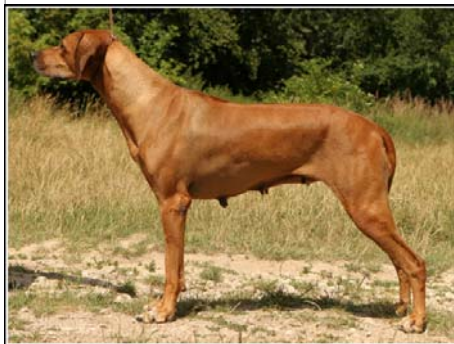
Balda Turkana Grandchampion SK Champion SK, H, BIH, CRO, SKCHR