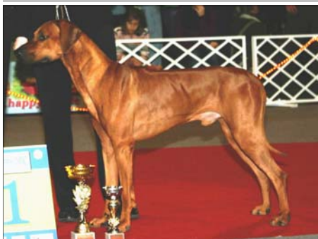
African Panthera Leo Coffie Derby Winner 2008, Derby BOB, BOB, BIG, r. BIS