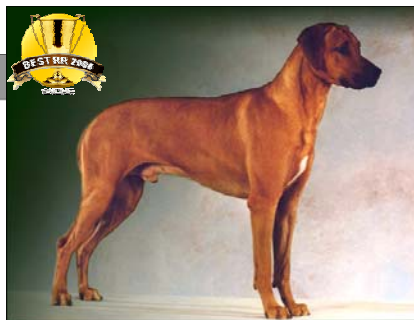
"Pes roka 2008"

3. miesto: Ch. Ajani Aibo (86 bodov) maj: Dana Mullerová