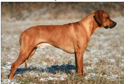
Chebale Perla Afriky Šampion PL, SRB, BIH, RO