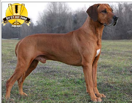
"Veterán roka 2008"

Získať v troch rozličných krajinách od troch rozličných rozhodcov štyri tituly CACIB bez