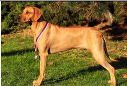
Tusani Extra Spice Juniorchampion CZ