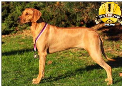
"Mladá vice-suka roka 2008" Jch. Tusani Extra Spice