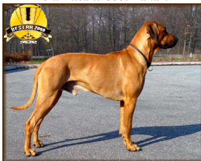
"Vice-pes roka 2008"