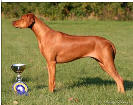
Hillvalley's Angel for Luanda Šampión Českej republiky a Slovenska