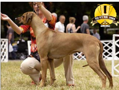
"Vice-suka roka 2008" Tusani Big BB