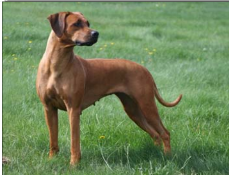
Cassia Ranua Šampión Nemecka