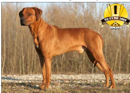
"Šampión roka 2008"