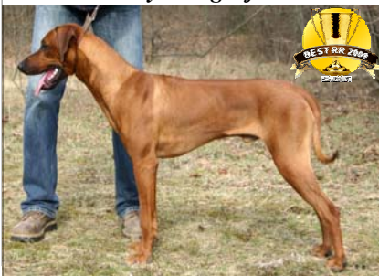
"Mladý vice-pes roka 2008" African Panthera Leo Coffie