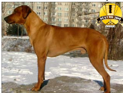
"Mladý pes roka 2008" Jch. Ridgeback Hiari Abayomi