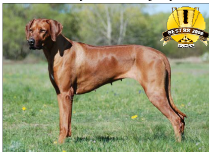
"Suka roka 2008"