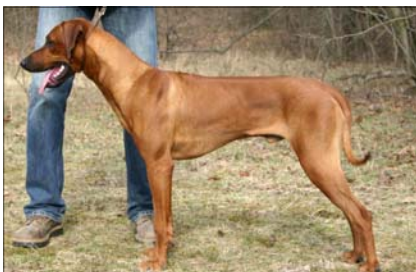
African Panthera Leo Coffie Junioršampion Slovenska