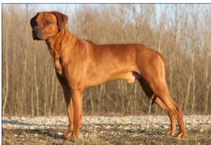
Chimalsi Balda Lowenschwanz Maďarský Šampion krásy

ci zistia, že je odovzdaný v banke začnú tlačit' na človeka, aby šteniatko odovzdal, tiež aj zvyšné peniaze žiadajú naspäť a tvrdia že peniaze prídu na účet, čo sa nikdy nestane. Od toho dňa, ako podvodník zistil, že šek som neodovzdala do banky, dokonca som ho žiadala, aby pôvodný šek stornoval a poslal zálohu cez Western Union Money Transfer sa už „záujemca“ viac neozval. Som šťastná, že sme tento podvod odhalili, lebo si neviem ani predstaviť, ako by to pokračovalo v opačnom prípade a hlavne to kde by naše šteniatko skončilo. Dúfam že nikto nenatrafí na takýchto podvodníkov a že šteniatkam vždy nájdete ten najlepší domov.