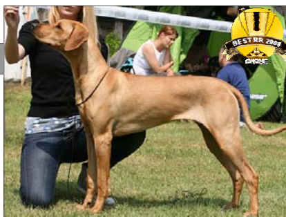
"Mladá suka roka 2008" Jch. Tusani Extra Chili

Chovateľská stanica a jej registrácia Žiadosti o chránenie názvu chovateľských