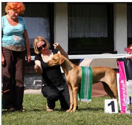
Tusani Extra Chili Najkrajšia mladá suka ŠV SKCHR 2008

Samozřejmě, vzhledem k tomu, k době ve které psi žijí, jakou mají stravu bohatou na proteiny, prakticky nekoušou, netrhají, vše je jim předkládáno až pod nos, obohacené vitamíny a minerály, a tak o tom se těm původním RR ani nezdálo, vypadali také jinak, byli chováni pro práci, dnes pro exteriér a povahu, jako výborní kamarádi. Tato skutečnost jasně