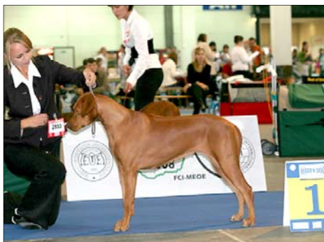
Ch.Hillvalley's Angel for Luanda CACIB, Evropský víťaz