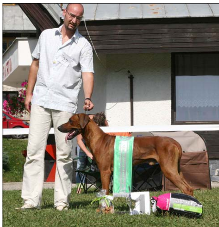
African Panthera Leo Coffie Najkrajší mladý pes ŠV SKCHR 2008

Nůžkový skus byl u všech jedinců v pořádku. Občas o něco světlejší oko. Někteří RR, zejména fenky, byly několik cm nad standardem 66 cm.