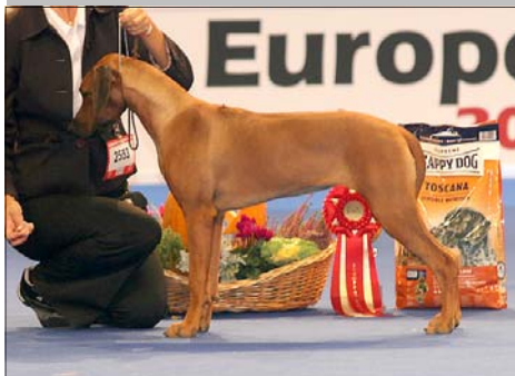
Alexis Femme Fatale Luanda Najkrajší dorast a res. Puppy BIS