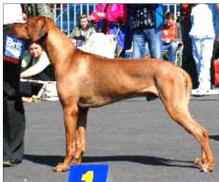
Šampion HU - Tusani Ani Jim Beam