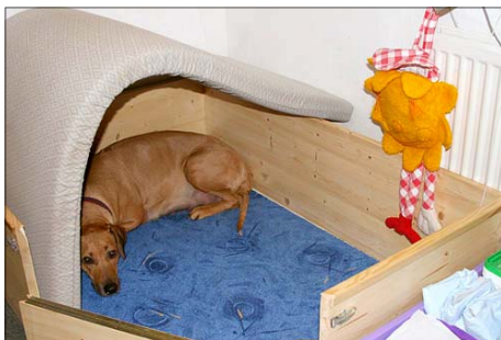
Zútulenie debničky pred pôrodom je ideálny kompromis medzi "norou" a debničkou