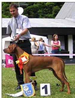
Ascot Alta Mirano - BOB XI.+XIII. KV SKCHR