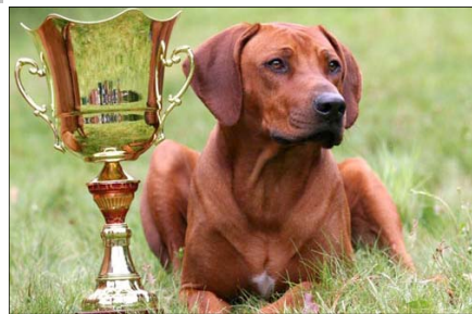
MultiCh, MultiJCh Djuba-Lee-Pepee von der Burg Littermont