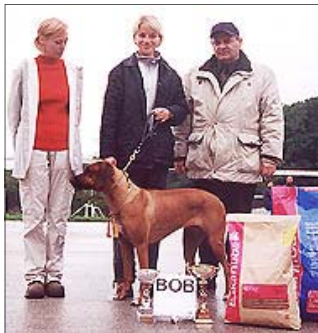
Urquelle Brill - BOB V. ŠV SKCHR

V. ŠV SKCHR 2001 Bojnice Rozhodca: Jaroslav Matyáš (SK) BOB - Urquelle Brill