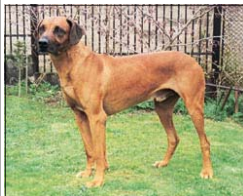
Antares - BOB II. KV SKCHR