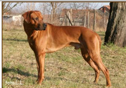
Šampión Českej republiky Chimalsi Balda Lowenschwanz