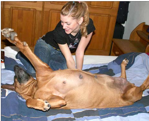
sučka Puppet deň pred pôrodom, stredobod pozorosti, šťastná a tešiaca sa každej náklonnosti

O príprave na pôrod ako aj samotnom pôrode už bolo veľa napísaného, existuje nespočetné množstvo článkov na internete, otázok a odpovedí vo fórach i veterinárnych poradniach. Nikdy ich však nie je dosť, vždy nás prekvapí nová situácia, nový problém.