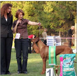
Fidorka Aquila Bojnice - BOB X. ŠV SKCHR