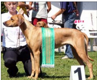
Macumazahn Tusani Pearl -BOB VIII. ŠV SKCHR