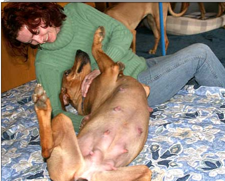
Sučka Vivi má radosť z každej návštevy a pyšne dáva na známosť 48. deň svojho tehotenstva

pôrodu. A tam začínajú komplikácie. Predpokladajme, že máme zdravú sučku so zachovaním všetkých prírodných inštinktov. Naše sučky plemena rodézske ridgeback nimi z veľkej väčšiny sú. Nepotrebujú okrem upraveného jedálnička a priestoru pre odpočinok nijako zvláštnu opateru pred pôrodom. Sú dobré matky, vedia čo a s nimi deje a čo majú robiť. Rodia samy, samy sa pripravujú na pôrod a samy udržiujú zvýšenú hygienu svojho tela i pelech. Je samozrejme, že aj my sa v tomto čase staráme vo zvýšenej miere o suku, jej hygienu i jej bezprostredné okolie, len chcem poznamenať, že naše sučky by boli schopné v pohode zvládnuť úplne všetko aj bez našej prehnanej starostlivosti. My to však robíme radi, lebo to je to jediné čím vieme prispieť (v ideálnom prípade bezproblémového pôrodu).