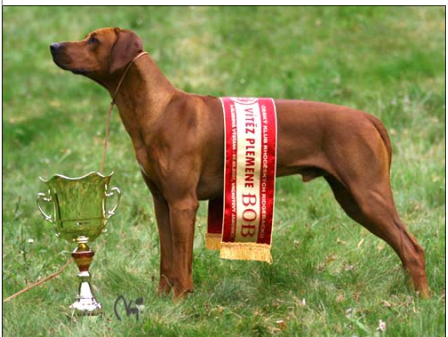
Šampion Slovenska, Čiech, Luxemburska a Montenegro Djuba-Lee-Pepe v.d Burg Litermont