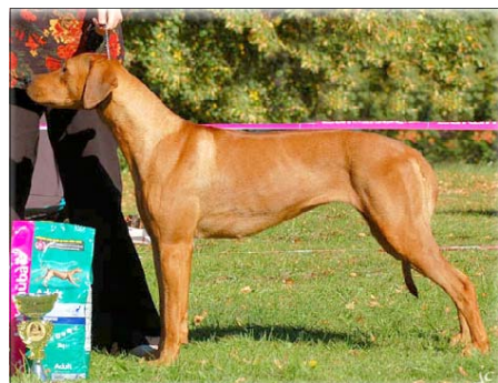
InterCH - Ch. Tusani Ani Pink Lady