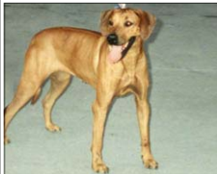
Auriga Rhodana - BOB I. KV SKCHR