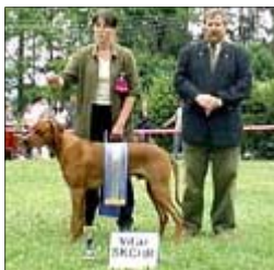
Hasani of Ka-Ui-Lis Ridges -BOB IX.+X. KVSCHR