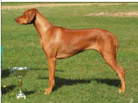
Šampión Maďarska Hillvalley's Angel for Luanda