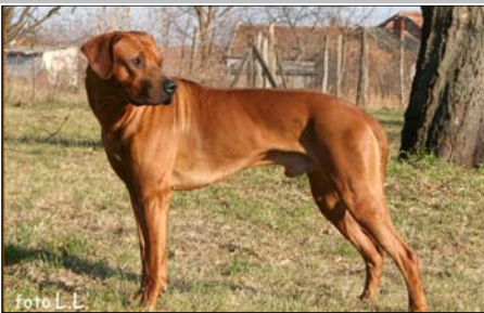
Chimalsi Balda Lowenschwanz - úspešné krytie v zahraničí (H) Národný víťaz ČR (Ostrava) 12.04.2008