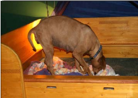
Sučka Vivi tesne pred pôrodom prvého šte- niatka. Pripravuje si miesto, hrabe, trhá...

jenie, pôrod bude s najväčšou pravdepodob- nosťou pokračovať úplne normálne.