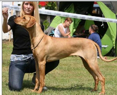
Hungaria JCH -Tusani Extra Chilli