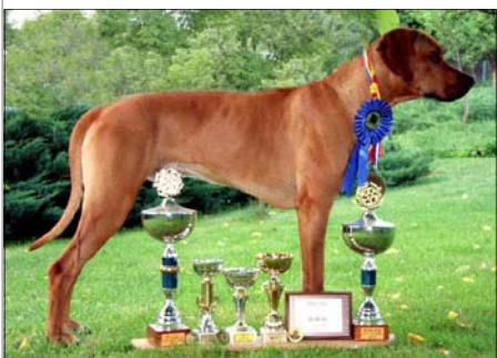
-Šampion Srbska, Rumunska Bosny a Hercegoviny Chebale Perla Afriky