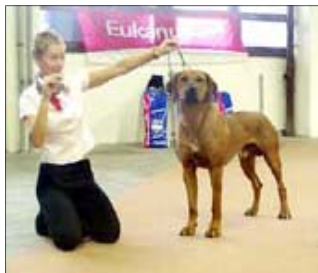
Matabo Mozi - BOB VII. ŠV SKCHR