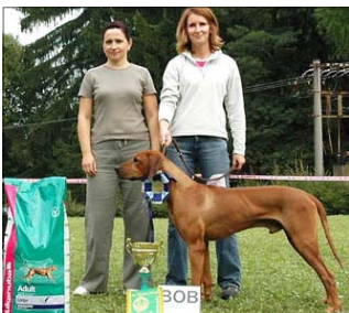
Falco z Údolí Rožnova - BOB IX+XI. ŠV SKCHR