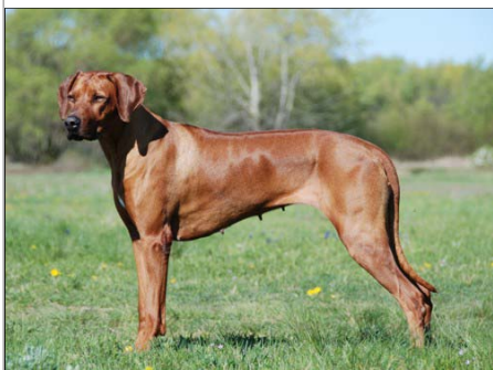
Šampión Slovenska Fidorka Aquila Bojnice