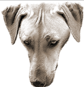
nesprávna hlava, široké vyduté líca