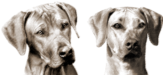
správna hlava a nasadenie uší u psa a suky, dobře vyjadrený pohlavný dimorfizmus