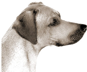
neparalelné línie temena a nosa