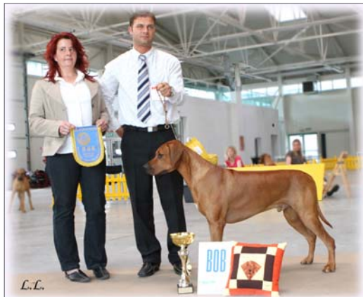
Klub. víťaz 2007, BOB - ICh. Ascot Alta Miráno