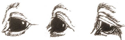
správne oko vypúlené oko vpadnuté oko