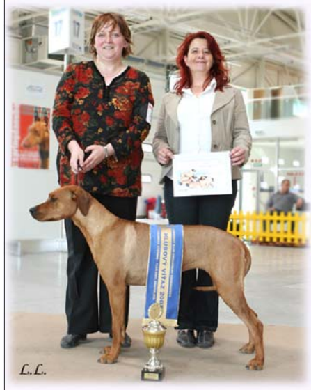
Tusani Ani Pink Lady - Klubový víťaz 2007

Najkrajšia hlava (pes): Ascot Alta Mirano Najkrajšia hlava (suka): Tusani Cool Coral Naj ridge: Hillvalley's Angel for Luanda Naj pohyb: Kennebec Dream Come True Najlepší plemenník: David Aquila Bojnice