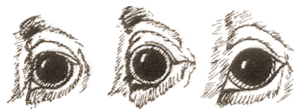
správne oko vypúlené oko vpadnuté oko