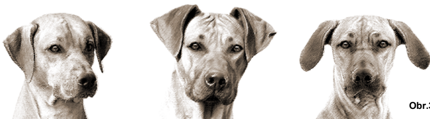
nízko nasadené uši

Pri pohľade zhora je u psa v pozore zadná časť dobre nasadených a nesených uší takmer v jednej línii so zadnou časťou temena (táto lúnia tvorí pravý uhol k chrbtici). Keď má pes uši vzadu, mali by tesne priliehať k zadnej časti líc a krku. Keď uši nie sú ani úplne vzpriamené, ani úplne vzadu, visia tak, že ich