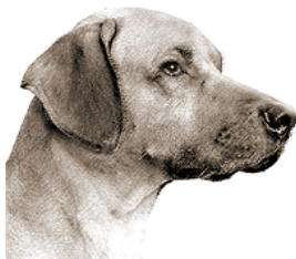
hrubá hlava, vyduté okružle temeno