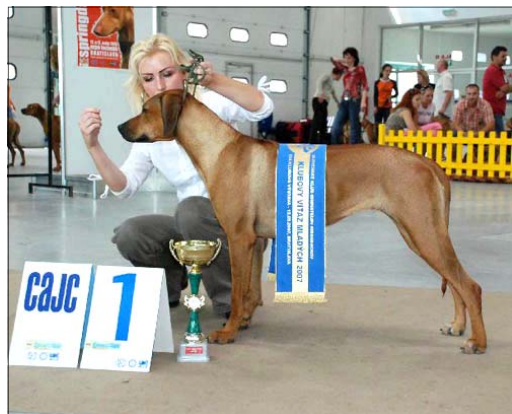
Ayra Grace Saracia - Klub. víťaz mladých 2007