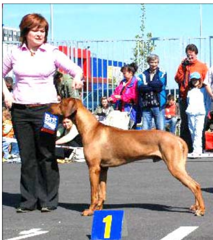
CACIB, BOB - Tusani Ani Jim Beam