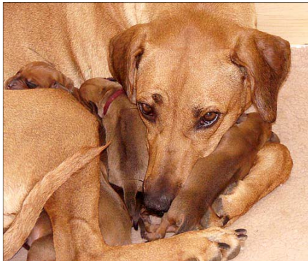
ilustračné foto, archív autorky článku

sa bez dozoru priblížilo bezprostredne k šteniatkam. Bola to pre suku už iná situácia a navyše nebola tam chovateľka, ktorá by matku preventívne upokojila.