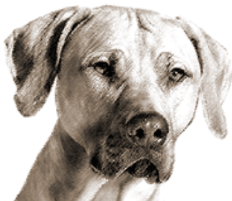
nesprávna hlava, široké vyduté líca

čiže má byť v oblasti stopu o niečo užšia ako na tyle. Ridgeback nie je ani mastif, ani whippet. Keď je temeno zjavne širšie ako dlhšie, hlava vyzerá príliš hrubo, "mastifovsky". Pri úzkom temene, čo je veľmi zriedkavé, vyzerá hlava ridgebacka naopak príliš jemne, "whippetovsky". V oboch týchto prípadoch je ovplyvnený