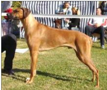
JCH. KENNEBEC DREAM COME TRUE