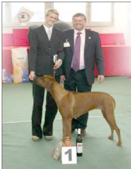
CACIB, BOB -BOSWELLI BEA SOLIPSE