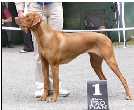
CH. LADY CHER