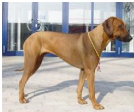
JCH. BOSWELLI BEA SOLIPSE