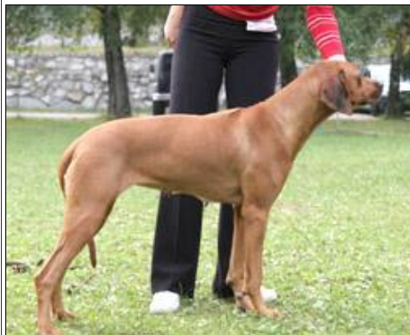
CH. AALIAH SLUNCE ŽIVOTA