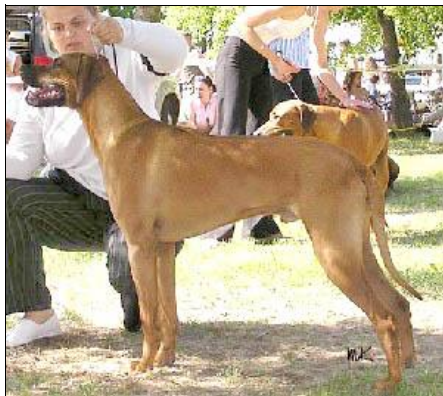
CH. A RAY OF LIGHT NYATHI