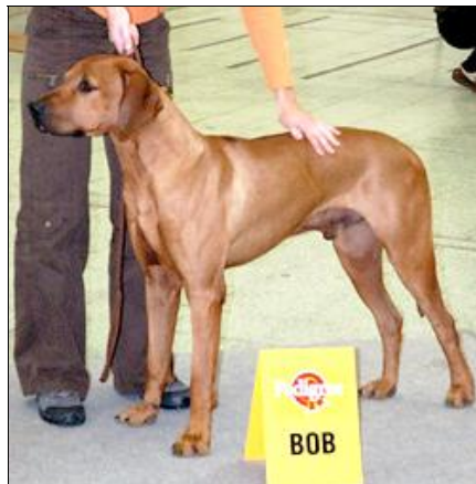
CACIB BOB - FALCO Z ÚDOLÍ ROŽNOVA

VN1 - GARI OD CYKASU VN2 - Artuš Leo Gugiro VN3 - Afro Leo Gugiro VN4 - Bakiri Aaliyah Löwenschwanz VN - Bangin Aaliyah Löwenschwanz VN - Atrei Leo Gugiro