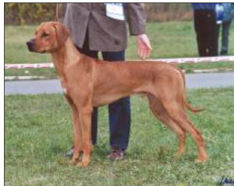
ICH. ASCOT ALTA MIRANO

Haika z Lukovského dvora nespĺnila podmienky, chýba účasť na výstave usporiadanej SKCHR