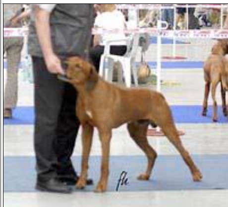
CH. ADAM Z BLEDEHO UDOLI