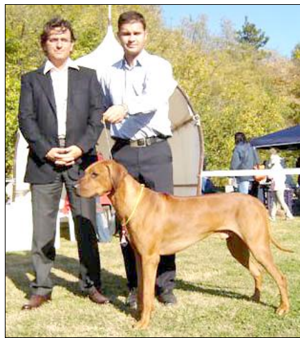
BOB oba dni - Ich. Ascot Alta Mirano