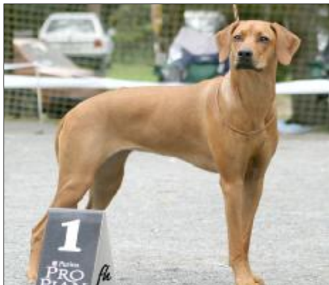
CH. CEYLLES CARTOUCHE