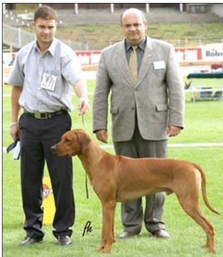
CWC, CACIB ASCOT ALTA MIRANO

V1, CWC, CACIB - ASCOT ALTA MIRANO Viček