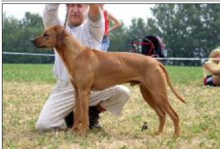
CAC, CACIB, BOB - Arat Wadaru's Kid