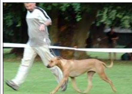
PERLA - Najkrajší pohyb