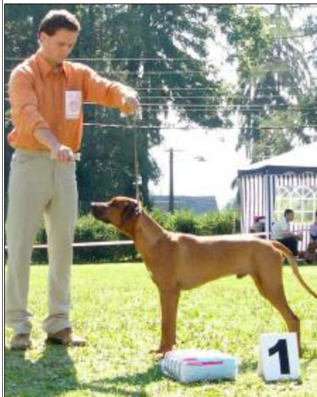
Csonkavári Régens Daran