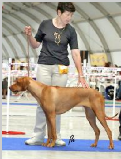
Lady Cher Junior Šampión CZ