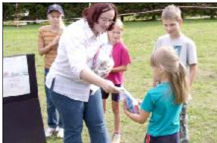
Odvzdávanie darčiekov malým umelcom