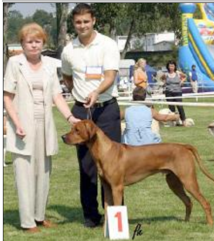
CAC, CACIB, BOB, 4.místo BIG Ascot Alta Mirano