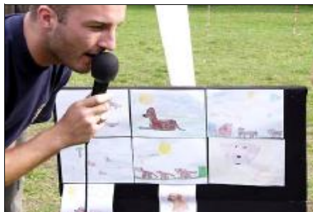
Vyhlasenie najkrajších detských kresieb