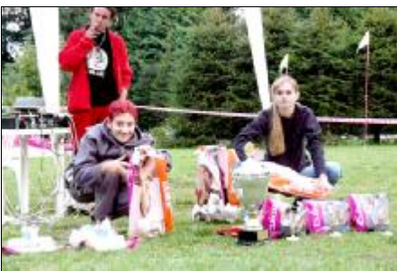
Rozdeľovanie darčiekov pre súťažiacich