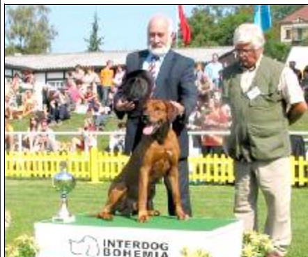
Najkrajší veterán ADAM Z BLEDEHO ÚDOLÍ