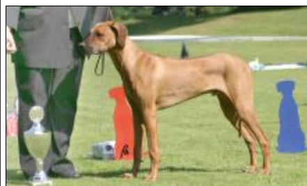
VN1 - A Ray Of Light Nyathi "Honzík"