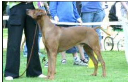
V3 - Filimon z Lukovského dvora