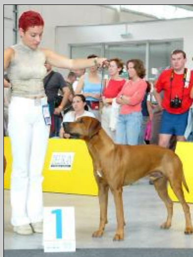
Amango z Tatianovho Dvora Šampión Slovenska