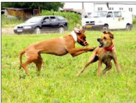
LARA a ALBA o návnadu