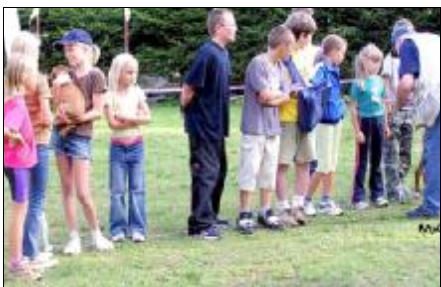
Nakoniec sa všetky deti dočkali sladkej odmeny