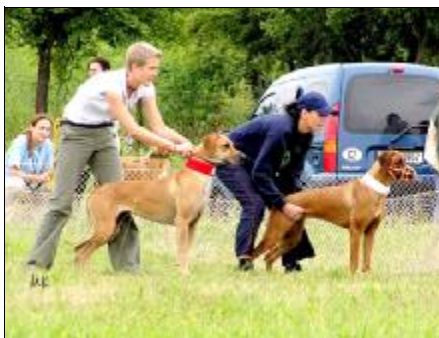
prvý beh ALBA +LARA