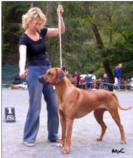
CAC, KV, BOB (BISS) M kai Leoridge