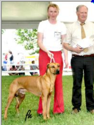
Ich.Casper Bohemia Gold Hungaria Šampión