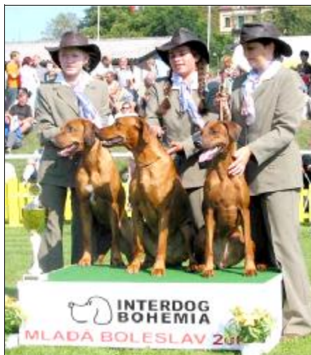
Najlepší chovateľská skupina Z LUKOVSKÉHO DVORA