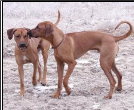
ADAK a AIBOO