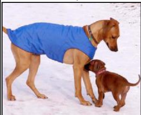
PERLA a BEA