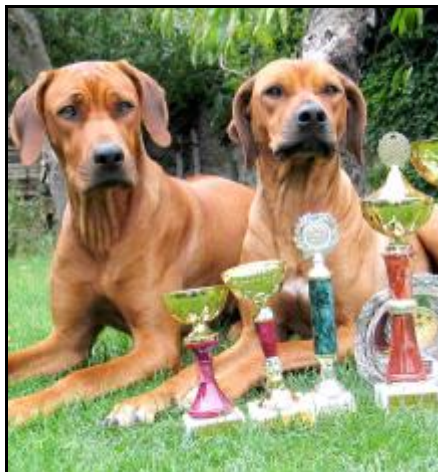
Aaliah Slunce života - Mladá suka roka 2003, Jch. Maďarska, Slovenska a Juhoslávie (vľavo)