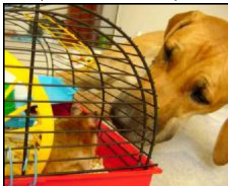
ALBA a ŠKREČOK