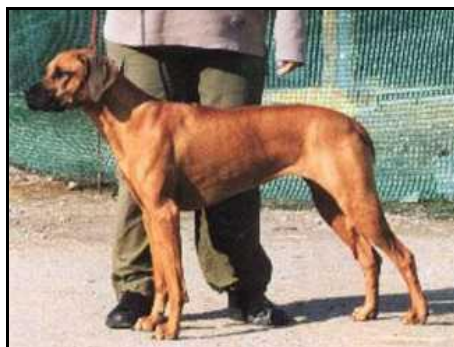
Ch. Terrouges Thembi “Svetový víťaz 2003“