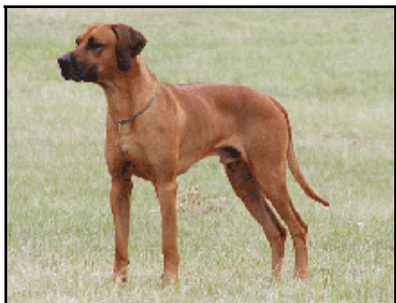
"LAPAJ" - Orix Rhodana Pes roka 2003