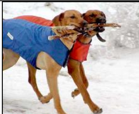
UPS - synchronizované doručovanie