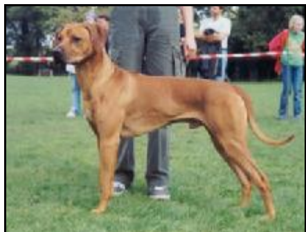
Ich. Amal Silesian Harta Pes roka 2003