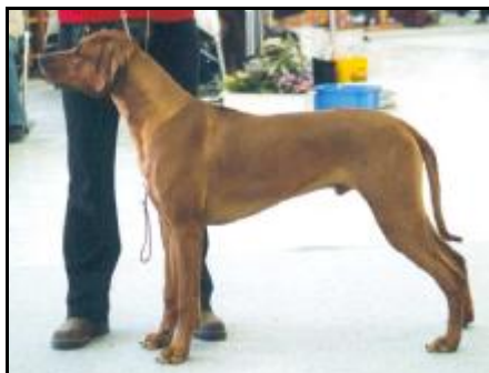
Jch. Hasani of Ka-Ul-Li's Ridge Mladý Pes roka 2003