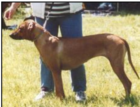
Ch. Bessy Saranga “Suka roka 2003“