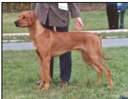
Ascot Alta Mirano Mladý europ.vítěz a Vice-Pes roka 2003