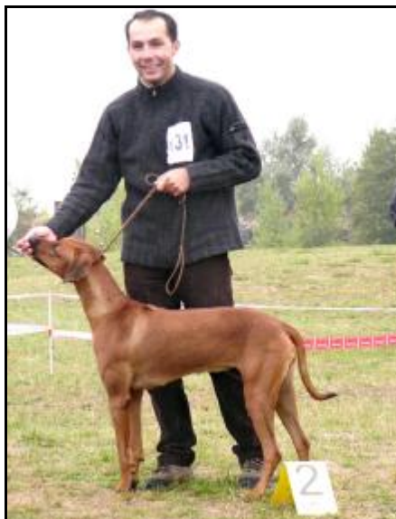
Haika z Lukovského dvora “Vice-Suka roka 2003“