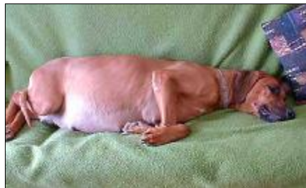
Ilustračné foto, zdroj: http://www.rr.sk/wadariuskid/a_litter.htm