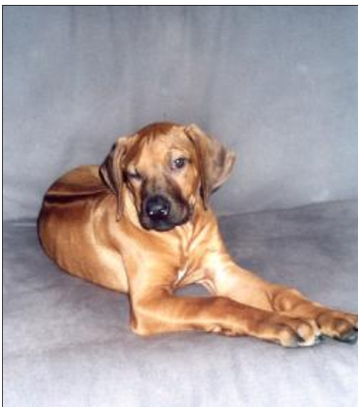
Ilustračné foto „ŽMURK“ Leoridge Musafah