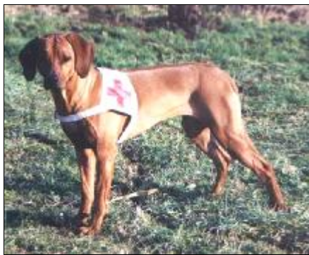
Dixi z Dianských luk