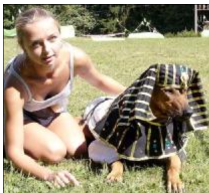
LADY - Cleopatra