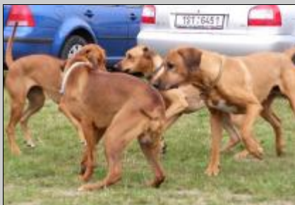
Posledný Adorov deň hier - plný sily a dobrej nálady šantí po výstave s novými kamarátmi.