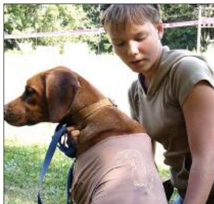
BEIMMEE - RR