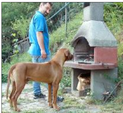
Adorkova najobľúbenejšia činnosť. August 2003