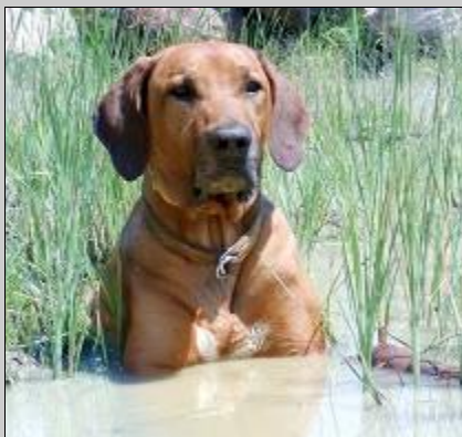
Jedno z posledných Adorkových "bahnení sa" v mláke. Leto 2003