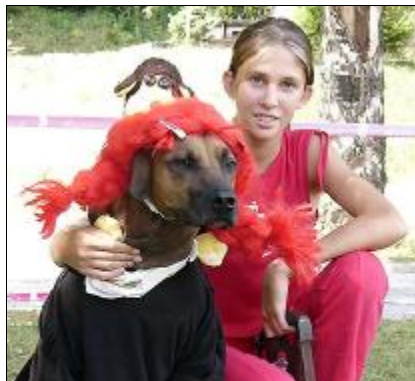
PEGY - Pipi dlhá pančucha