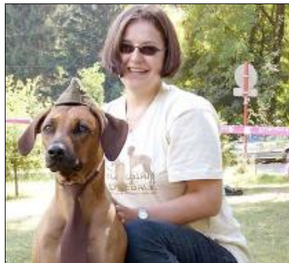
ASIA - Partizánka, brigádníčka SNP