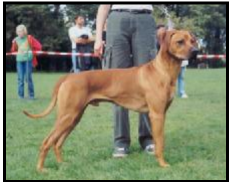
Ich. Amal Silesian Harta "Pes roka 2002"