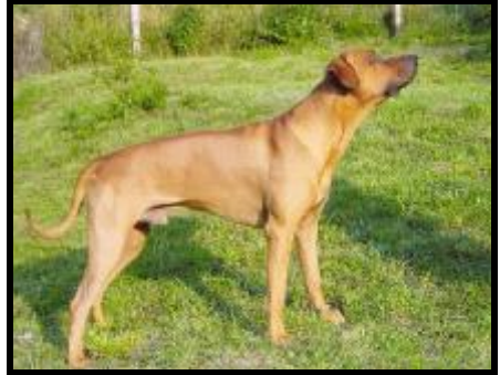
Jch. Malož Dabobo "Mladý pes roka 2002"

Poplatok za Slovenský Grand Šampion je 400,-Sk/Kč (20,- EUR), za Slovenský Šampión Veteránov je 100,-Sk/Kč (5,-EUR)