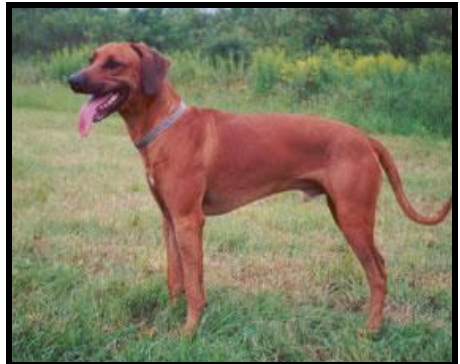
Ch. Casper Bohemia Gold "Pes roka 2002"