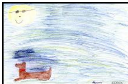
autor kresby: Hanka Hegyiová