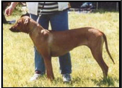
Ch. Bessy Saranga

- Pretty Polly Ropotamo k titulu “Mladá suka roka 2002“