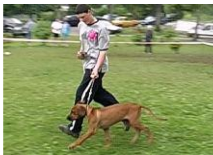
Súťaže pre mladých vystavovateľov "Dieťa a pes" a "Junior Handling" I. a II. kat.