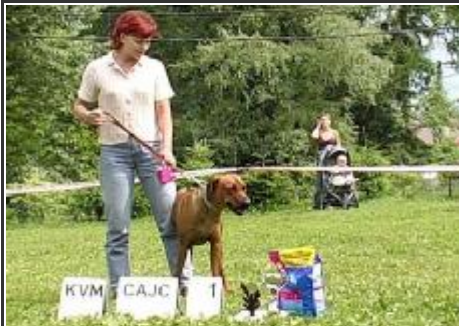
Alis od Jezerních mokřin