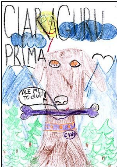
CIARA - autor: Jaroslav Štefanko, 11 rokov