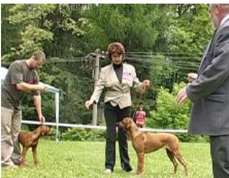
Najlepšie predvedený pes VIII. KV SKCHR Macumazahn Malawi Magic, suka tr.baby