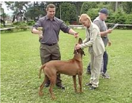
Najúspešnejší potomok psa Ador Bukama Ch. African Red Stone Arnold