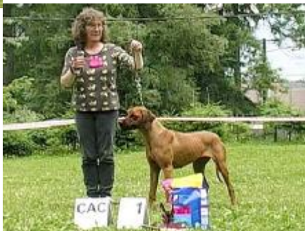
Pretty Polly Ropota-