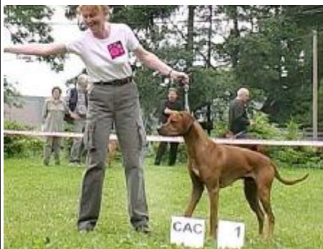
Ich. Amal Silesian Harta