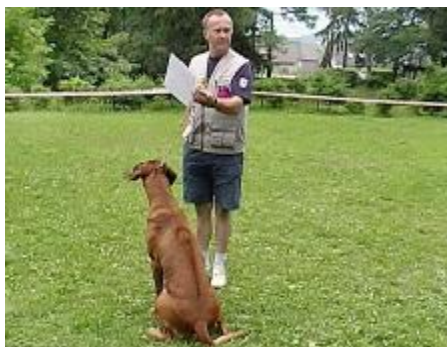
Najkrajší ridge VIII. KV SKCHR Ch. Calibre M'Khulu Bass