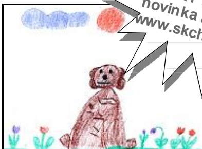
Gabika Kolcunová, 8 rokov