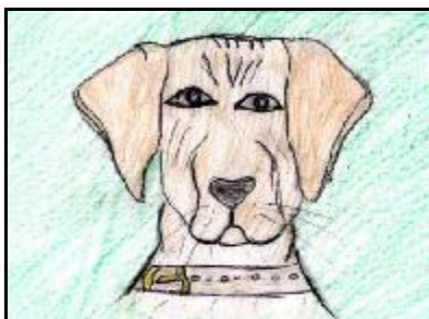
Lenka Kollárová, 13 rokov