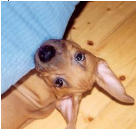
Dabobo - víťazná fotografia internetovej súťaže www.rr.sk