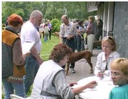
Bonitácia - vážna udalosť v živote každého psíka

Bonitačná komisia v zložení - poradca chovu: A.Mičuchová, rozhodca: T.Havelka, zapisovateľ: A.Friedrichová, za formálnu správnosť: M.Tušanová, J.Brezová - posúdili 6 jedincov (1 psa/ 5súk). Do chovu sa zaradilo 5 jedincov (1/4). Jedna suka pre nekorektný ridge nespĺnila podmienky pre zaradenie do chovu.