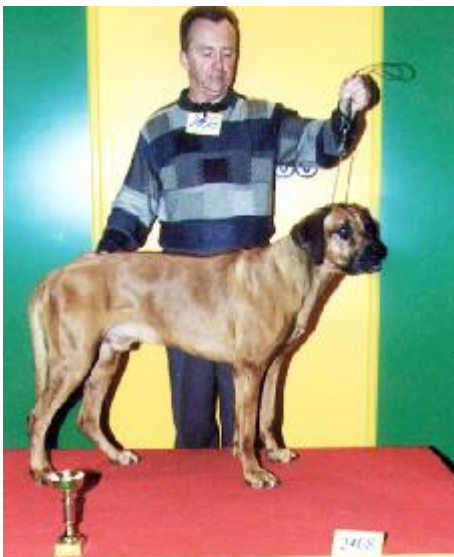
Ch. M' Khulu Baas Calibre

splnil podmienky pre udelenie titulu Interšampión