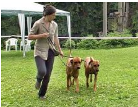
Najkrajší pár VIII. KV SKCHR Malози Dabobo + Miss Maira Ropotamo