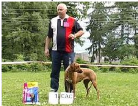
Ch. Bendy z Vrboveckého mlýna