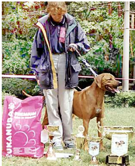
Ich. Amal Silesian Harta Klubový šampión SKCHR