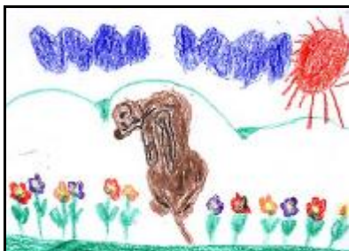
Jakubko Kollár, 9 rokov