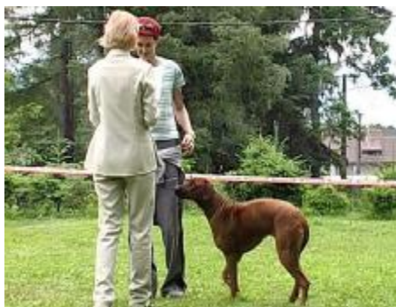
Najkrajšia hlava VIII. KV SKCHR Bajka Agátový kvet