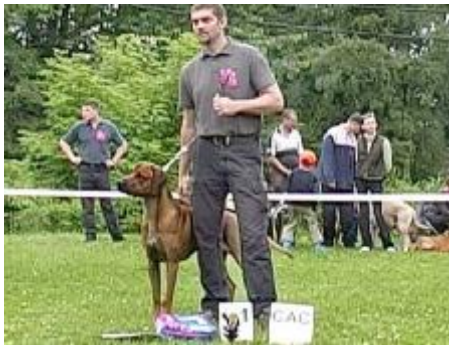
Ares z Leczynskiego pojeziera